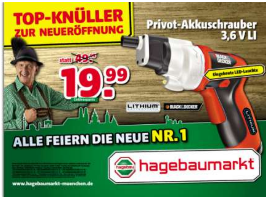
Abbildung 1: Testimonial ( http://www.serviceplan.com/de/kampagne-details/hagebau-servus-hagebaumarkt.html , Zugriff vom 23.05.17)