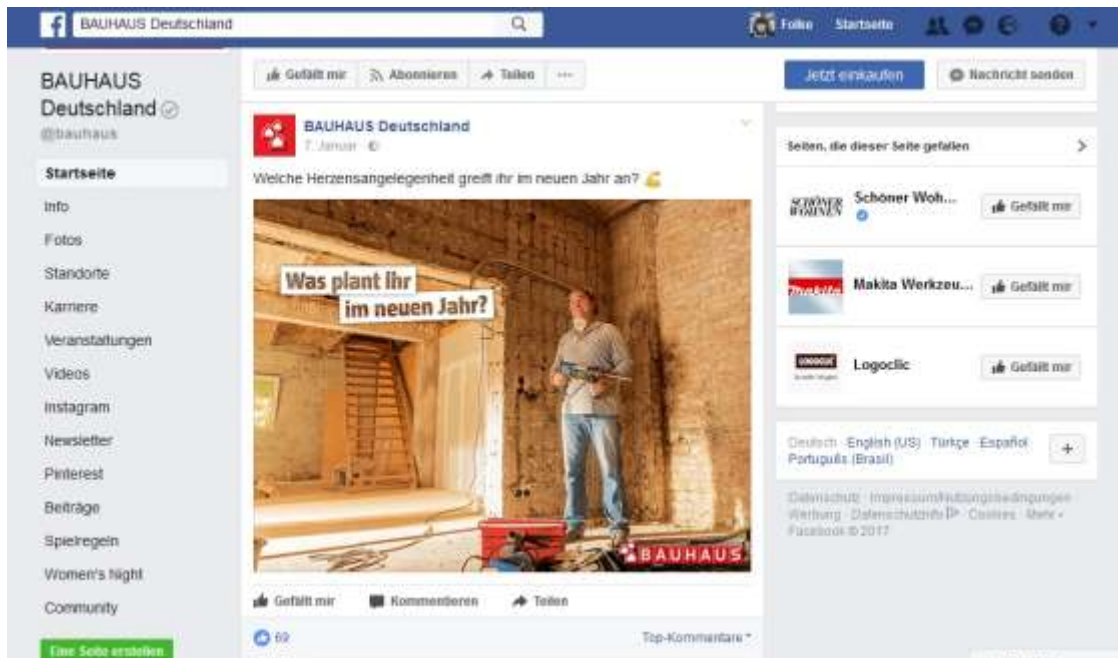
Abbildung 2: Bauhaus - Herzensangelegenheit

Diese Art der Werbung dient nicht nur der Bindung des Kunden, sondern ist auch ein Versuch der Baumärkte, kommende Trends zu entdecken.