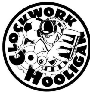
Abb. 2 Wappen der Clockwork Hooligans