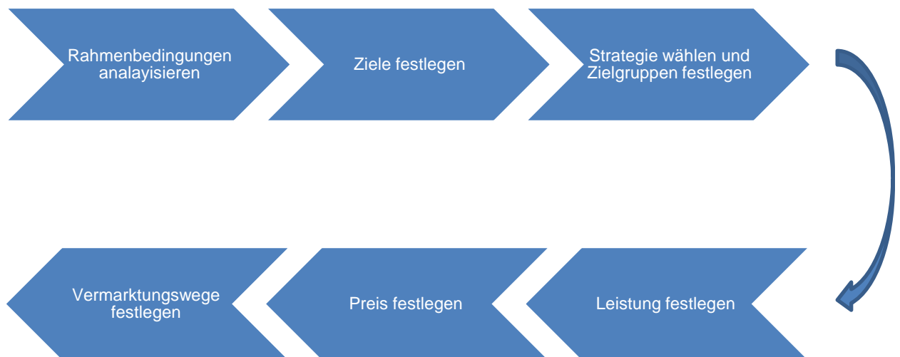
Abbildung 1 Produktentwicklung im Tourismus 6

Die Produktpolitik eines Unternehmens ist das Resultat aller Entscheidungen, die sich auf die Gestaltung bestehender und zukünftiger Produkte des Unternehmens beziehen. 5 Um die Entwicklungsphasen eines Produkts im Tourismus innerhalb der Produktpolitik zu wissen, zeigt die Abbildung 1 einen solchen Ablauf.