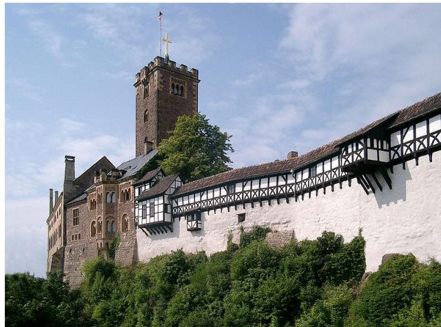
Abbildung 4 UNESCO Weltkulturerbe und Wahrzeichen der Stadt Eisenach: Die Wartburg

Insgesamt zählten die Eisenacher Beherbergungsbetriebe ab neun Betten 172.739 Ankünfte im Jahr 2011. Immerhin konnten auch 17.486 ausländische Gäste in der Destination begrüßt werden. Wie bereits erwähnt hat Eisenach mit einer durchschnittlichen Aufenthaltsdauer von 1,7 Tagen einen schweren Stand im Vergleich zu seinen Thüringer Mitbewerbern. Insgesamt wurde im Jahr 2011 eine Anzahl von 293.877 Übernachtungen generiert, was im Vergleich zum Vorjahr eine Steigerung von 1.3 % darstellt (2010: 293.494 Übernachtungen). Leider sind die ausländischen Übernachtungen im Vergleich zum Vorjahr deutlich gesunken. Ihr Anteil lag bei 28.360 Übernachtungen im Jahr 2011, was einem Abfall im Vergleich von fast 13 % zum Vorjahr darstellt. Hier liegt die durchschnittliche Übernachtungsdauer lediglich bei 1,6 Tagen. Der Großteil der ausländischen Gäste kam aus den USA, gefolgt von Japanern und Gästen aus den Nachbarländern Holland und Schweiz. 33