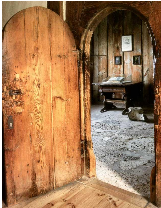
Abbildung 6 Die Lutherstube auf der Wartburg 37

Das touristische Highlight (USP) der Stadt Eisenach ist und bleibt die Wartburg mit seiner Lutherstube. Dieser authentische Wohn- und Arbeitsort des Reformators ist seit Jahrhunderten Ziel unzähliger Pilger und wird gerne als Zugpferd des touristischen Portfolios der Wartburg Stiftung und der Stadt Eisenach gesehen.