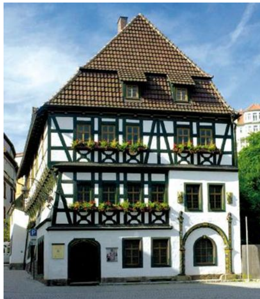
Abbildung 5 Das Lutherhaus in Eisenach 36

Das Lutherhaus ist nur eines von vielen touristischen Produkten zum Thema Luther, was die Stadt Eisenach zu bieten hat. Neben den klassischen Stadtführungen bietet die EWT eine besondere Stadtführen mit den sogenannten „Lutherfindern“ an. „Lutherfinder“ sind durch die evangelische Erwachsenenbildung Thüringen ausgebildete und zertifizierte Gästeführer, die Gästebegleiten möchten um die Spuren Luthers in dieser Region zu finden. Sie erläutern Ihnen die Zusammenhänge zwischen Geschichte und Theologie und führen Sie zu Orten und Zeugnissen der Reformation, die Ihnen auf vielfältige Weise vermittelt werden. Darüber hinaus hat die EWT mehrere thematische Stadtführungen mit den Lutherfindern zusammengeschürt, um das Thema Reformation und Martin Luther professionell in der Region zu vermarkten. 35