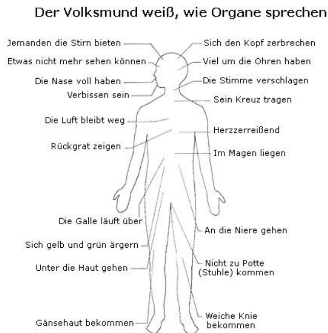
Abbildung 2: Redewendungen über körperliche Beschwerden

Die ständigen Anfeindungen der Mobber führen zu verschiedenen gesundheitlichen Beeinträchtigungen und Beschwerden beim Opfer. Der hohe seelische Stress belastet auch den Körper, der dann auf diese Belastung reagiert. Für diese verschiedenen körperlichen Reaktionen gibt es im Volksmund Redewendungen, die sich auf die Symptome der einzelnen Körperregionen beziehen (s. Abb.2).