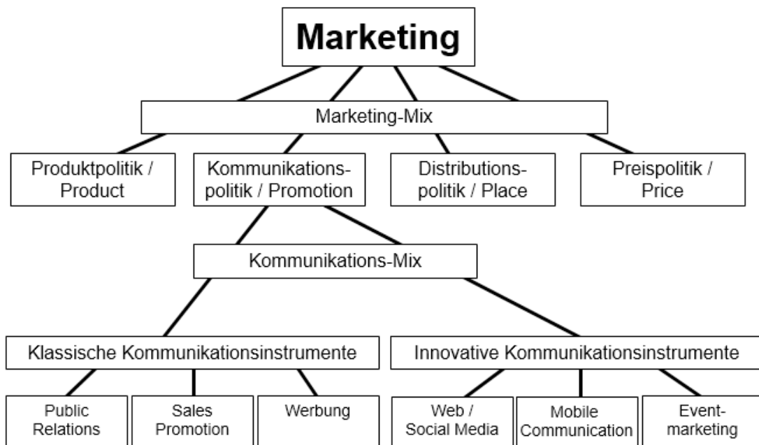
Abbildung 5: Marketing-Mix (Kreyher 2015, 11)

Produkte werden in verschiedene Bereiche eingeteilt. Kernprodukte bieten nur Grundfunktionen an. Generische Produkte hingegen heben die Alleinstellungsmerkmale von anderen Produkten hervor. Erwartete Produkte bieten keinerlei Innovationen und erfüllen die vorausgesetzten Erwartungen der Zielgruppe. Werden zu den Grundfunktionen individuelle Funktionen hinzugefügt, liegt ein augmentiertes Produkt vor. Neben dem augmentierten Produkt hebt sich das potenzielle Produkt auf Grund von weltneuen Innovationen ab (vgl. Fritz/von Oelsnitz 2006, 146 f.).